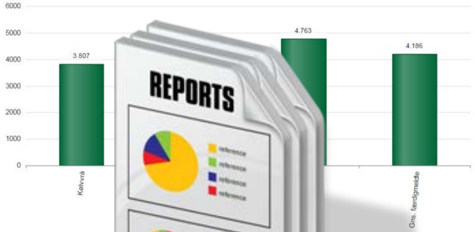
Udbytte, renvægt kg/ha